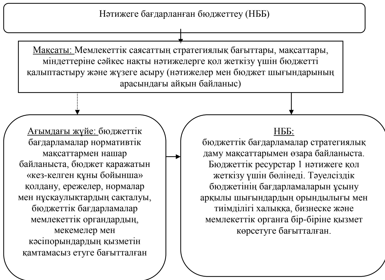
Сурет 9 - НББ енгізуден алынған нәтижелер

стратегиялық жоспарлау теориясының - нәтижеге бағдарланған бюджеттеудің (НББ) пайда болуын көздейді (9-сурет).