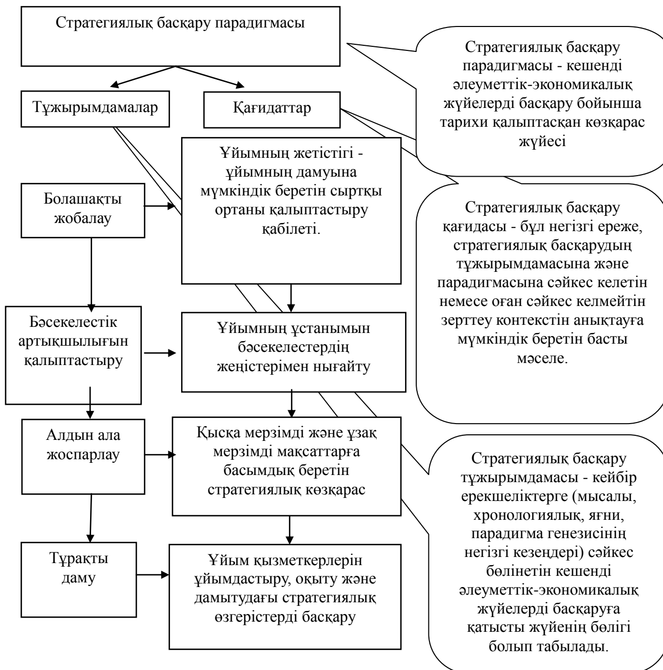
Сурет 10 - Аймақтың стратегиялық жоспарының мәні мен мазмұны