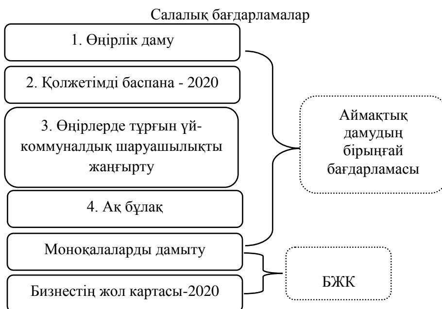
Сурет 11 - Аймақтарды дамытудың бірыңғай бағдарламасының құрылымы

3. Өңірлерді дамытудың бірыңғай бағдарламасы "Өңірлерді дамыту", "моноқалаларды дамытудың 2012-2020 жылдарға арналған бағдарламасы", "2011-2020 жылдарға арналған тұрғын үй-коммуналдық шаруашылықты жаңғырту", "2011-2020 жылдарға арналған Ақ бұлақ", "Қолжетімді тұрғын үй 2020" бағдарламаларын біріктіру негізінде әзірленді (11-сурет).