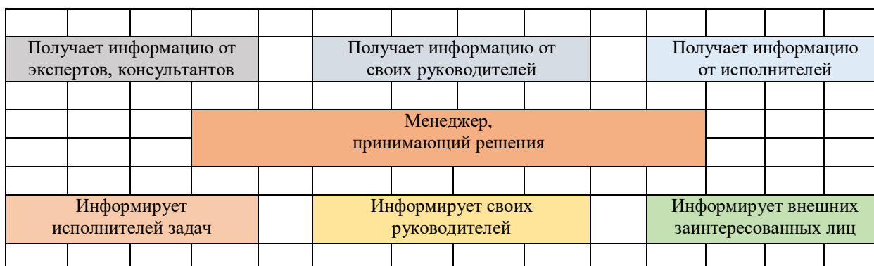
Рис. 2. Менеджер как система обработки информации.

Менеджер – руководитель, прошедший процедуры профессионального отбора и специальной подготовки в области управления организацией, способный к достижению поставленных собственником целей и задач, соответствующих уставу организации (Рис. 2).