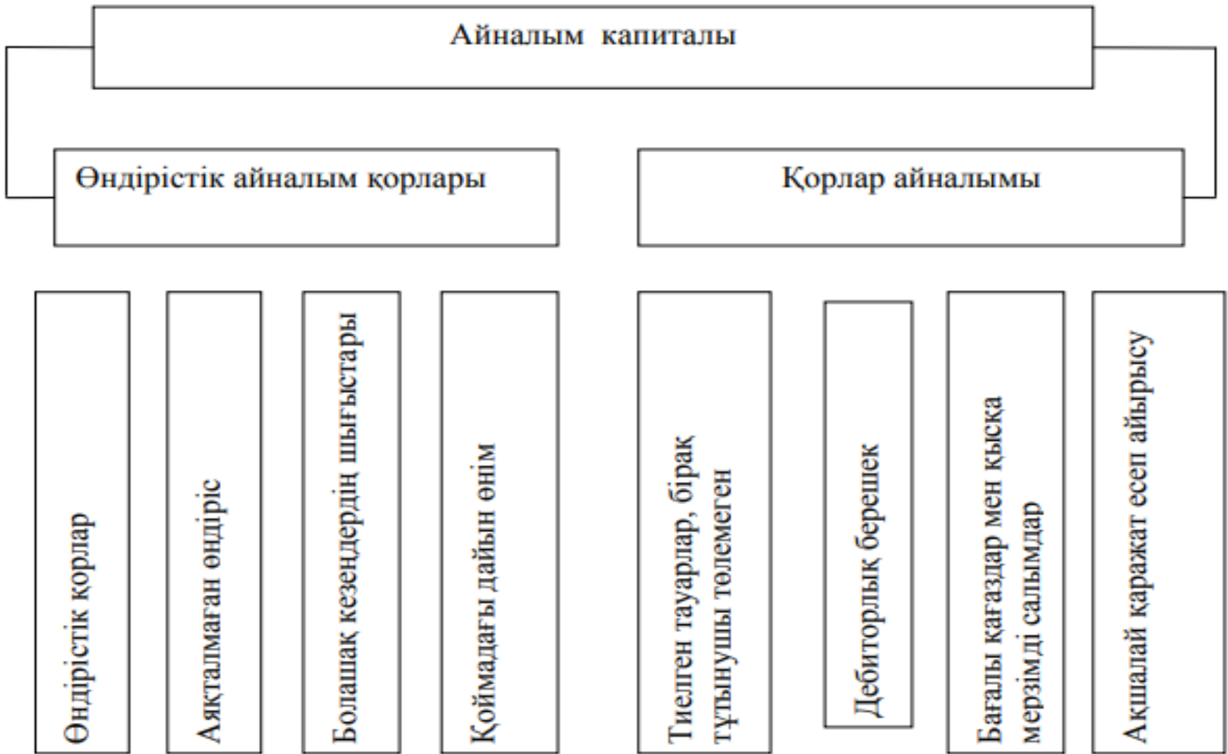
Сурет 1. Айналым капиталының өндіріс процесіндегі функционалдық рөліне байланысты классификациясы(жіктелімі)