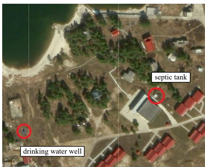
Расположение скважин и септиков