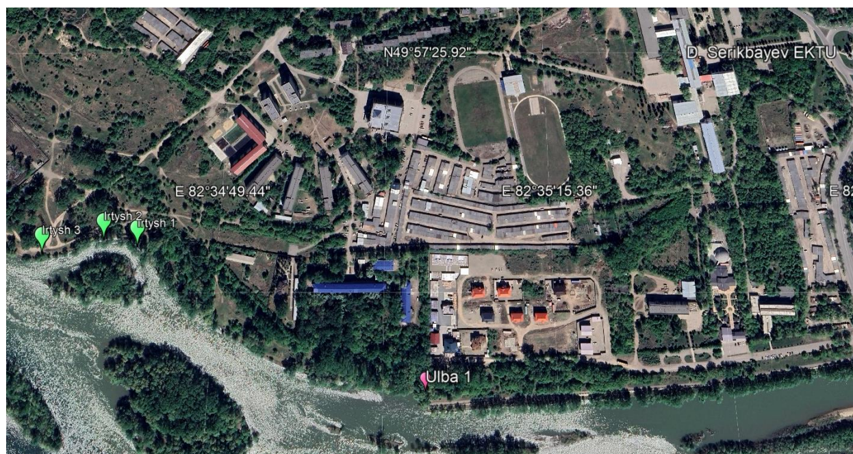
Точки отбора Иртыш и Ульба