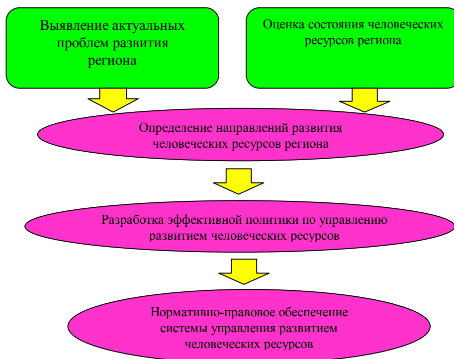
Рисунок 1 – Алгоритм процесса управления развитием человеческих ресурсов

Управление развитием человеческих ресурсов региона предполагает различные направления и формы воздействия на человека как носителя трудовой, политической, общественной функции. И поскольку направление воздействия должно соответствовать актуальным потребностям развития региона и повышению качества жизни населения, нам представляется целесообразным следующий алгоритм по управлению этим процессом (рис. 1).