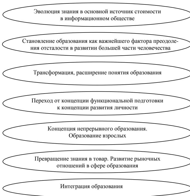
Рисунок 1 – Основные тенденции мирового образования

Для того чтобы создание современной информационной инфраструктуры в развивающихся странах способствовало не только повышению прибылей развитых стран, участвующих в финансировании этого процесса, но и, главным образом, содействовало преодолению социально-экономической отсталости развивающихся стран, необходимо использование новых технологий в международном бизнесе в целом. А это требует и современных технических систем, и определенных знаний, навыков, умений, моделей поведения у граждан всего международного сообщества. В то же время, становление информационного общества требует качественного повышения человеческого и интеллектуального потенциала развивающихся стран и тем самым выдвигает сферу образования в них на первый план общественного развития. От решения проблем образования, которые всегда остро стояли в развивающихся странах и которые еще более усугубились в последние десятилетия в связи с бурным развитием информационных технологий, зависят сейчас перспективы социально-экономического развития этих стран, решения глобальной проблемы преодоления отсталости не только в отдельной стране, но и в мире в целом.